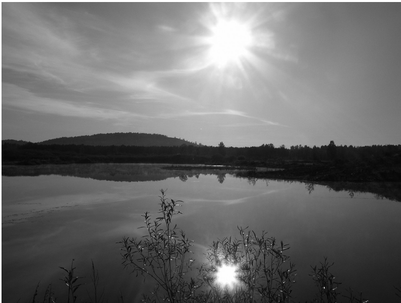
Рис. 2. Ручейный карьер в верховьях реки Миасс – последствия деятельности старателей-золотодобытчиков.