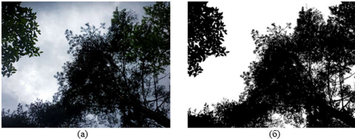
Рис. 1. Фотографии крон до обработки в Adobe Photoshop (а) и обработанное бинарное изображение (б).