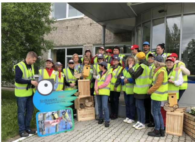
Рис. 5. Проведение акции «Хранители птиц» на территории предприятия ООО «Хенкель Рус».