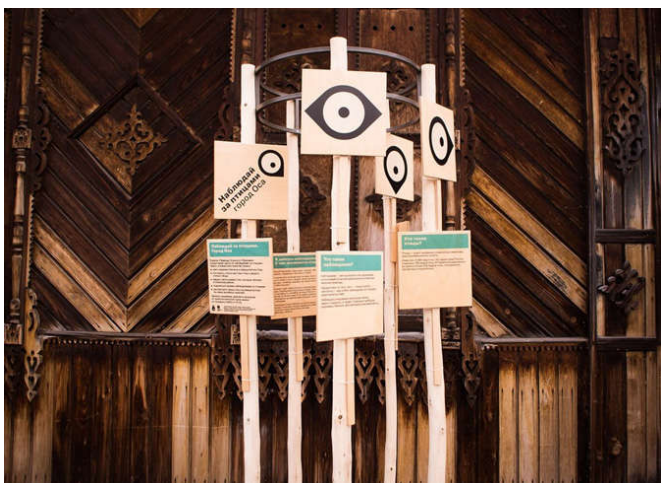
Рис. 1. Автор дизайна и логотипа проекта Петр Стабровский.