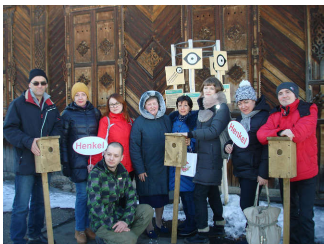
Рис. 3. Подарок от коллектива ООО «Хенкель Рус».