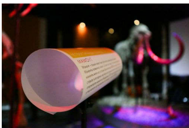
Рис. 9. Антропоценоскоп. Дизайн: Петр Стабровский.

Еще одно переосмысление коллекций было реализовано в виде сайта «Привет, Антропоцен!» ( https://helloanthropocene.ru ), где мы попытались показать разные очевидные и скрытые связи между современными процессами, происходящими в природе здесь и сейчас, и предметами палеонтологической, ботанической и зоологической коллекций нашего музея (рис. 9). И предметы хранения тоже стали, таким образом, экспонатами для очень широкой аудитории интернет-посетителей!