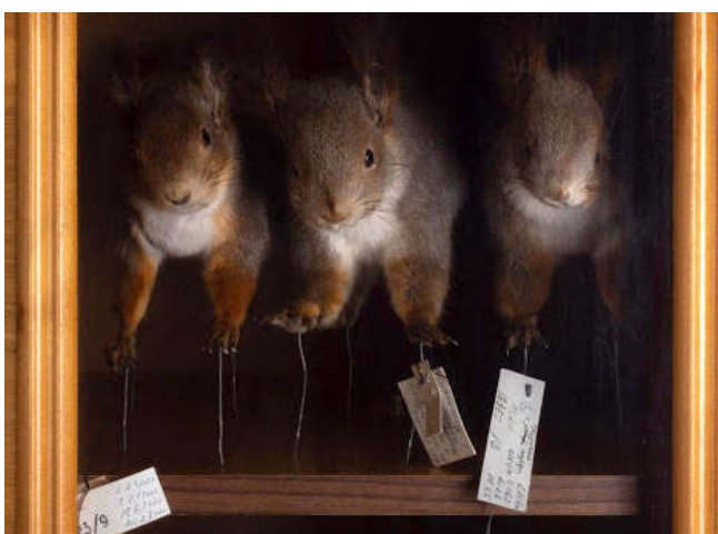
Рис. 7. «The Dioramas of the Permian Museum» (диорамы в Пермском краеведческом музее).