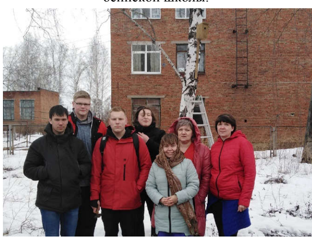
Рис. 4. Студенты и коллектив «Осинского колледжа образования и профессиональных технологий».

ры выражают глубокую признательность сотрудникам «Хенкель Рус» за подарок и нашим друзьям-студентам и коллективу за помощь в размещении скворечников.