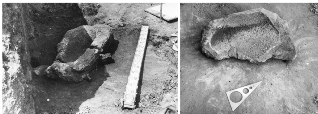
Рис. 1. Каменные ванны с поселения бронзового века Токское.

Следы металлургической деятельности зафиксированы также вокруг колодца. Здесь обнаружено большое количество фрагментов медной руды, металлургических шлаков, кости животных с медной минерализацией, оплавленные глыбы песчаника. Рядом с колодцем обнаружено четыре фрагмента керамики с ошлакованной внутренней поверхностью.